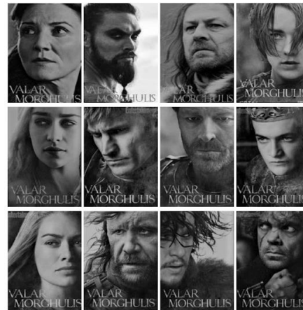
Fig. 3 : Quelques visages de nos stars de la cohorte 1

Au vu des résultats nous avons donc décidé de retenir les cohortes suivantes (Fig. 4) : Maintenant que nous savons que les personnages qui apparaissent tôt dans les saisons sont effectivement plus importants, il convient de vérifier s'ils meurent moins.