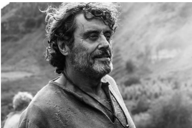
Remarque : Frère Ray fait partie de la cohorte 4 puisqu'il apparaît pour la première et dernière fois à l'épisode 607.

Un premier modèle confirme ce qui a été vu avec les courbes de survie : à durée de survie égale, les personnages de la cohorte 4 ont trois fois plus de risque de décéder au cours d'un épisode que les personnages de la cohorte 1.