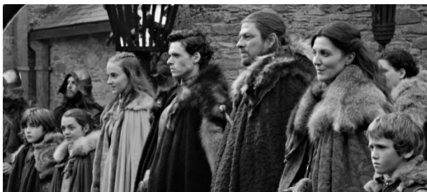
Fig. 1 : Les personnages du premier épisode, des personnages inoubliables

Un postulat hasardeux et répandu : De nombreux auteurs prétendent qu'aucun personnage n'est à l'abri de la mort. Les démographes que nous sommes veulent mettre à l'épreuve ce postulat hasardeux car non vérifié statistiquement ! Certes, vous avez été choqués par la mort de Ned ou par celle de Robb, deux personnages ô combien importants. Mais peut-on faire de deux exemples une généralité ? Non. Nous ne le répéterons jamais assez : les images sont trompeuses.